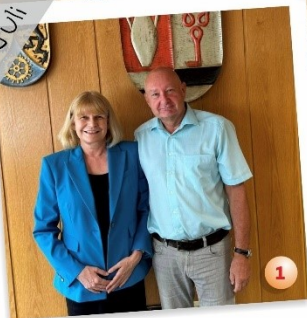
Tettau mit 1. Bürgermeister Peter Ebertsch