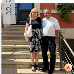
Marktrodach mit 1. Bürgermeister Norbert Gräbner