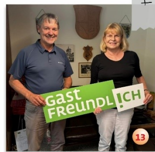
Steinwiesen mit 1. Bürgermeister Gerhard Wunder